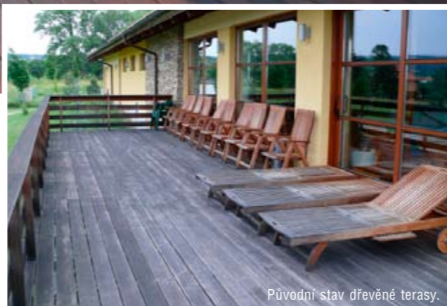
Původní stav dřevěné terasy.

Na praktickém příkladu jedné hotelové terasy si ukážeme správný postup každoroční údržby, ale také to, jak by péče o venkovní dřevo vypadat neměla. Výchozí situací je pět let stará dřevěná terasa kolem hotelového bazénu. Její každoroční údržba spočívala v tom, že jakmile na jaře roztál sníh a oteplilo se, byla zametena, spláchnuta vodou a po zaschnutí natřena olejem. Tento nesprávně volený postup vedl k tomu, že povrch nikdy nebyl řádně vyčištěn a zbaven přilnutých nečistot, docházelo k vrstvení používaného oleje, uzavírání špíny mezi jednotlivé nátěry a po pěti letech vypadal povrch dřeva jako by tam ležel 30 let.